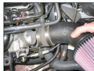
Fig. # 12

For technical support contact our European technical team: "eindhoven.tech@knfilters.com" We will try to answer your mail within 48 hours.