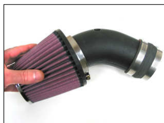
Fig. # 10