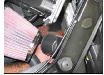
Fig. # 16