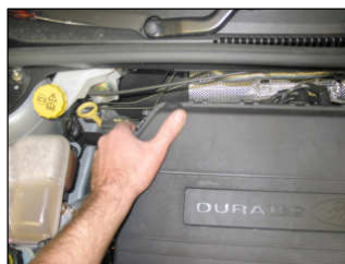
Fig. # 7