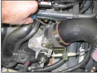
Fig. # 13

Ford Fiesta 1.25L &1.3L 8v (Duratec) L4 04/2002-02/2003