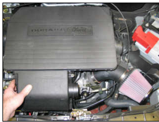
Fig. # 18