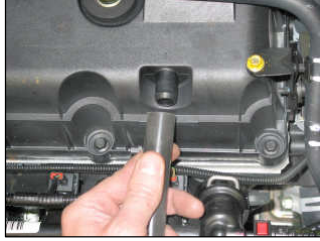
Fig. # 14