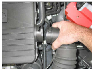
Fig. # 1

For cleaning instructions please visit our website: www.knfilters.com/cleaning