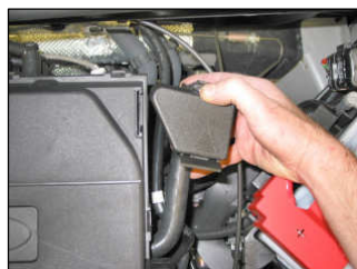
Fig. # 6