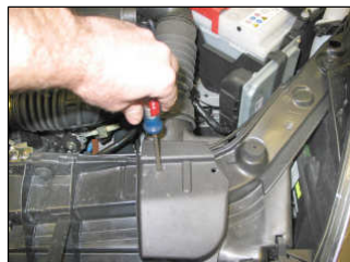
Fig. # 2