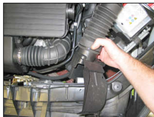
Fig. # 3