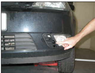
Fig. # 17