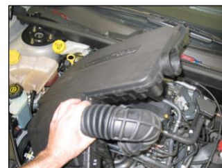
Fig. # 8