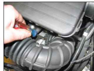
Fig. # 4