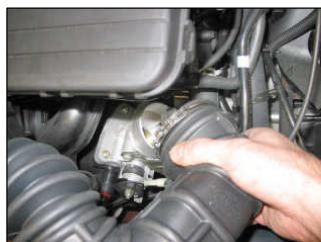
Fig. # 5