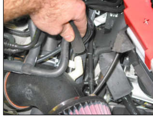
Fig. # 15