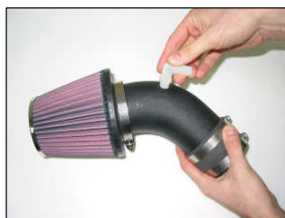
Fig. # 11