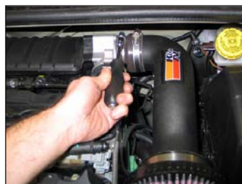
Fig. # 22