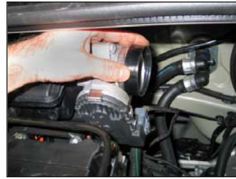
Fig. # 11