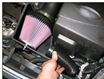
Fig. # 26