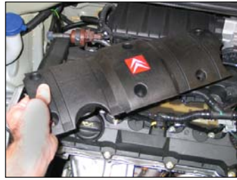
Fig. # 6