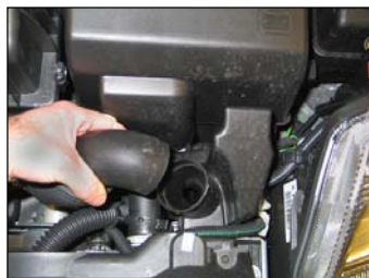
Fig. # 2