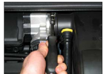
Fig. # 4