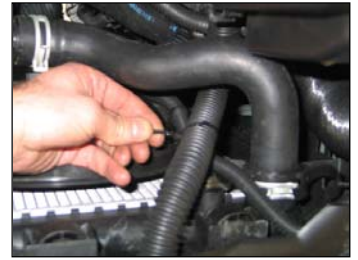
Fig. # 12