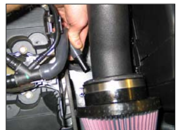
Fig. # 24