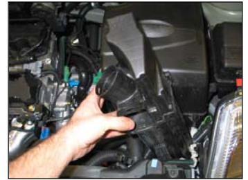
Fig. # 8