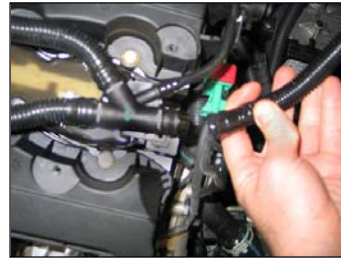
Fig. # 7