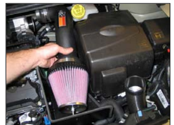
Fig. # 20