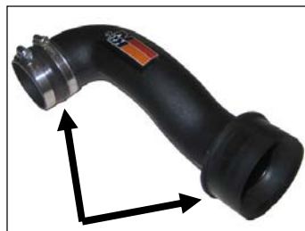
Fig. # 18