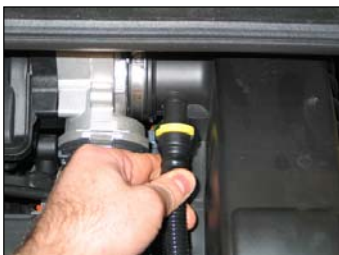
Fig. # 1

FILTER MAINTENANCE: K&N suggests checking the filter periodically for excessive dirt build-up. When the element becomes covered in dirt (or once a year), service it according to the instructions on the Recharger service kit available from your K&N dealer, part number 99-5000 or 99-5050.