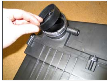
Fig. # 10