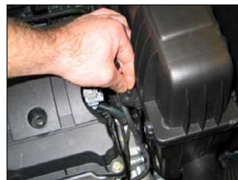
Fig. # 3