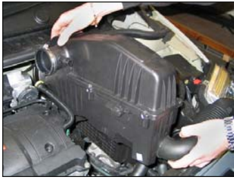
Fig. # 5