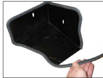
Fig. # 15