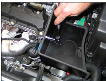
Fig. # 17