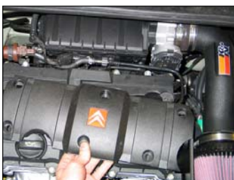
Fig. # 25