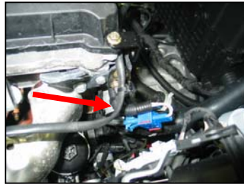
Fig. # 14