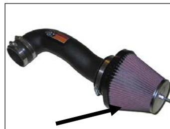
Fig. # 19