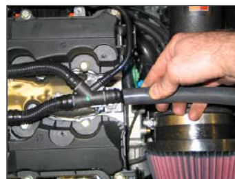
Fig. # 23