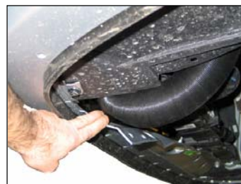
Fig. # 27