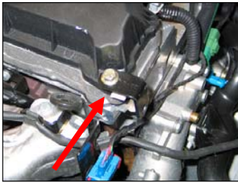
Fig. # 13