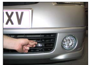
Fig. # 28