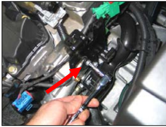
Fig. # 9