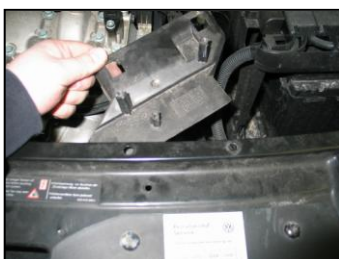
Fig. # 12