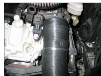
Fig. # 14