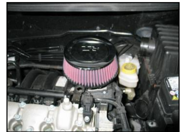
Fig. # 7