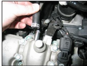
Fig. # 2