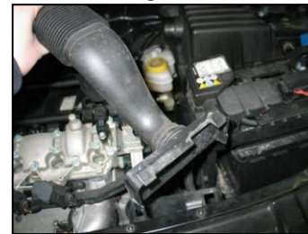
Fig. # 6