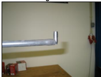
Fig. # 8