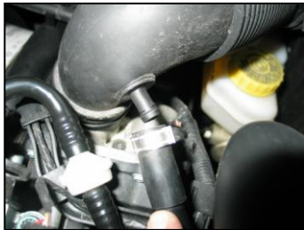
Fig. # 1

For technical support contact our European technical team: "eindhoven.tech@knfilters.com" We will try to answer your mail within 48 hours. For UK technical enquiries contact R&D department at 01925-636950, Mon-Thu from 8:30 am to 5 pm