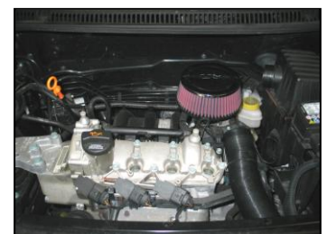
Fig. # 15