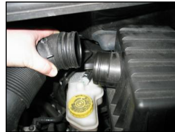
Fig. # 3