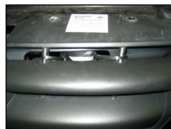
Fig. # 13