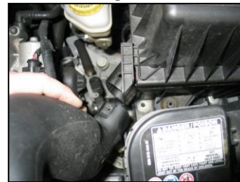
Fig. # 5