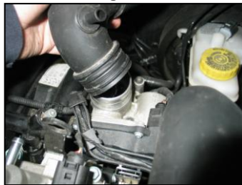
Fig. # 4