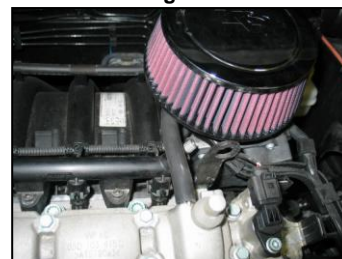
Fig. # 9